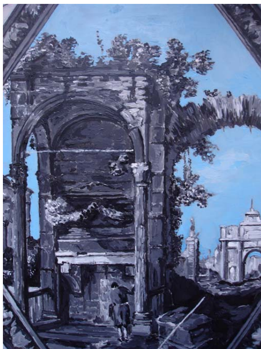
Sofia Leitão, détail d'une sculpture (acrylique sur plaque de zinc), 2009